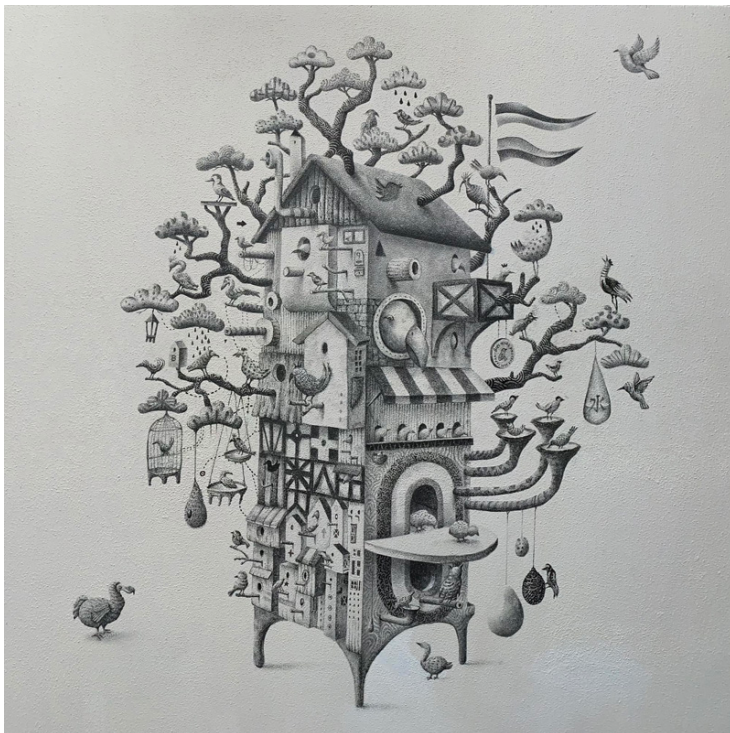
世界鳥類巣箱大図鑑