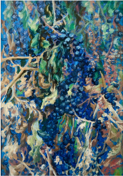
What Is Love 2