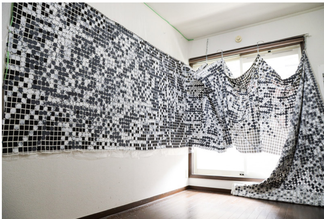
Mind Games 'I Am Here'