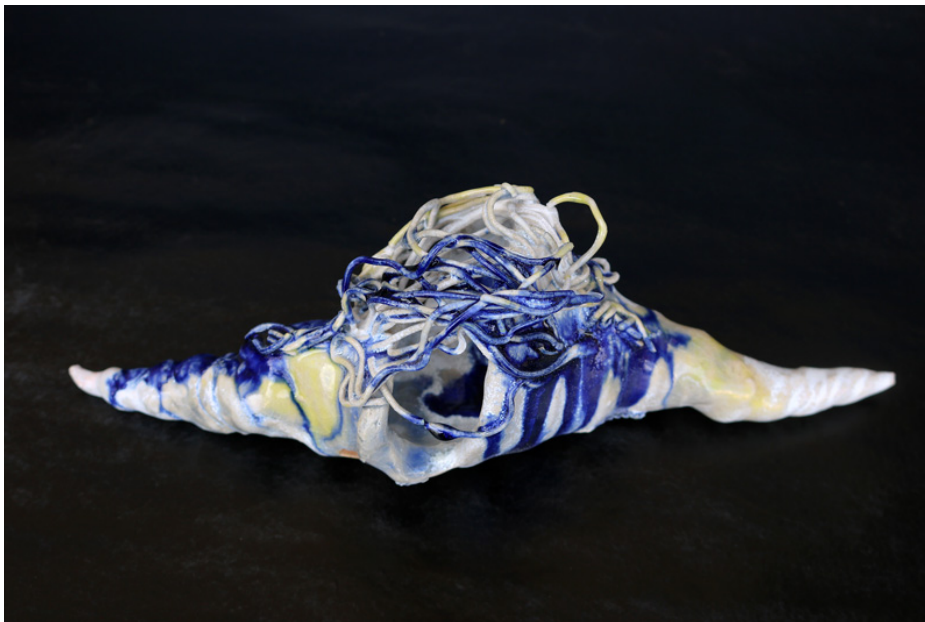
津田友子 結界の記憶 ソラリスより 陶 8×22.5×8cm 2022 年