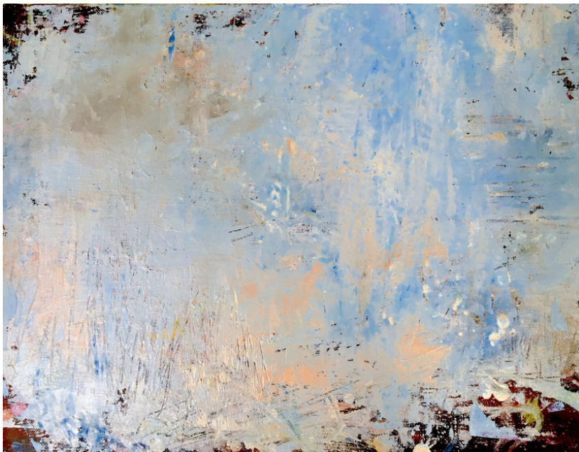
寺島みどり ソラリス 油彩／キャンバス 32×41cm 2020年