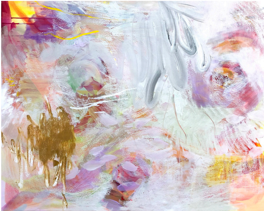
寺島みどり 心の弱い人のもの 油彩／キャンバス 72.2×91cm 2018年